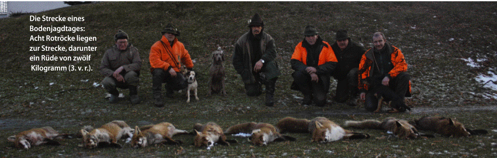
Die Strecke eines Bodenjagdtages: Acht Rotröcke liegen zur Strecke, darunter ein Rüde von zwölf Kilogramm (3. v. r.).

Jäger Georg verfolgt den Räuber mit seinen Augen, backt die Flinte an. Erster Schuss vorbei, weiterschwingen, zweiter Schuss. Der Fuchs rolliert, rappelt sich aber sofort wieder auf. Die Schrotgarbe hat ihn zu weit hinten gefasst. Sekundenschnell lädt der Schütze seine Flinte nach, doch an einen weiteren Schuss ist