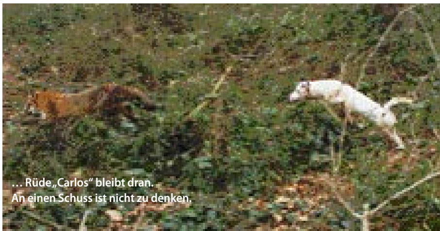
... Rüde „Carlos“ bleibt dran. An einen Schuss ist nicht zu denken.