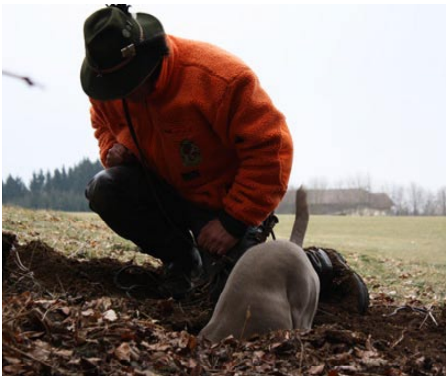
Terrier „Duffy“ hat die Anschlussröhre gefunden und Weimaraner „Anni“ versucht ebenfalls einzuschließen.

Unterdessen läuft „Duffy“ auf dem Bau hin und her. An zwei weiteren Röhren versucht sie, ihrem Gefährten beizuschlagen, findet jedoch keinen Zugang und fährt rückwärts wieder aus. Nervös läuft sie über die Burg, verhofft und sticht regelrecht mit ihrer Nase ein paar Mal auf den harten Boden. Plötzlich scharrt und buddelt sie energisch mit ihren Vorderläufen. In wenigen Minuten ist der halbe Körper der Terrierhündin in dem kleinen Einschlag verschwunden.